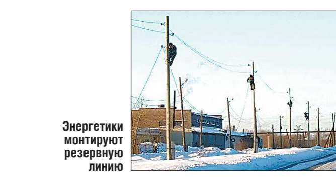
Энергетики монтируют резервную линию