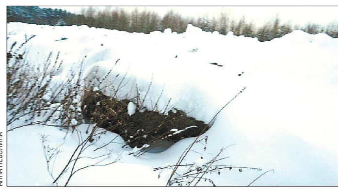
Обледеневшие куски уже успело засыпать новой порцией снега

ков, коих в районе менее десятка, с нужной температурой. Но дальше, в зоне ответственности обслуживающей компании, батареи холодные. В школе, например, на теплосчётчике температура — плюс 70, а на батарее — 39–40. Все проблемы идут из-за неэффективной работы обслуживающей компании. Раньше этим занималась управляющая компания, но она находится в стадии банкротства. Связаться с обслуживающей компанией «ОГ» не удалось. По мнению представителей «Горэнерго», решить ситуацию можно, заменив трубы и стояки. Но процесс тормозится из-за необходимости финансовых вложений. Соответствующие переговоры с обслуживающей компанией ведутся.