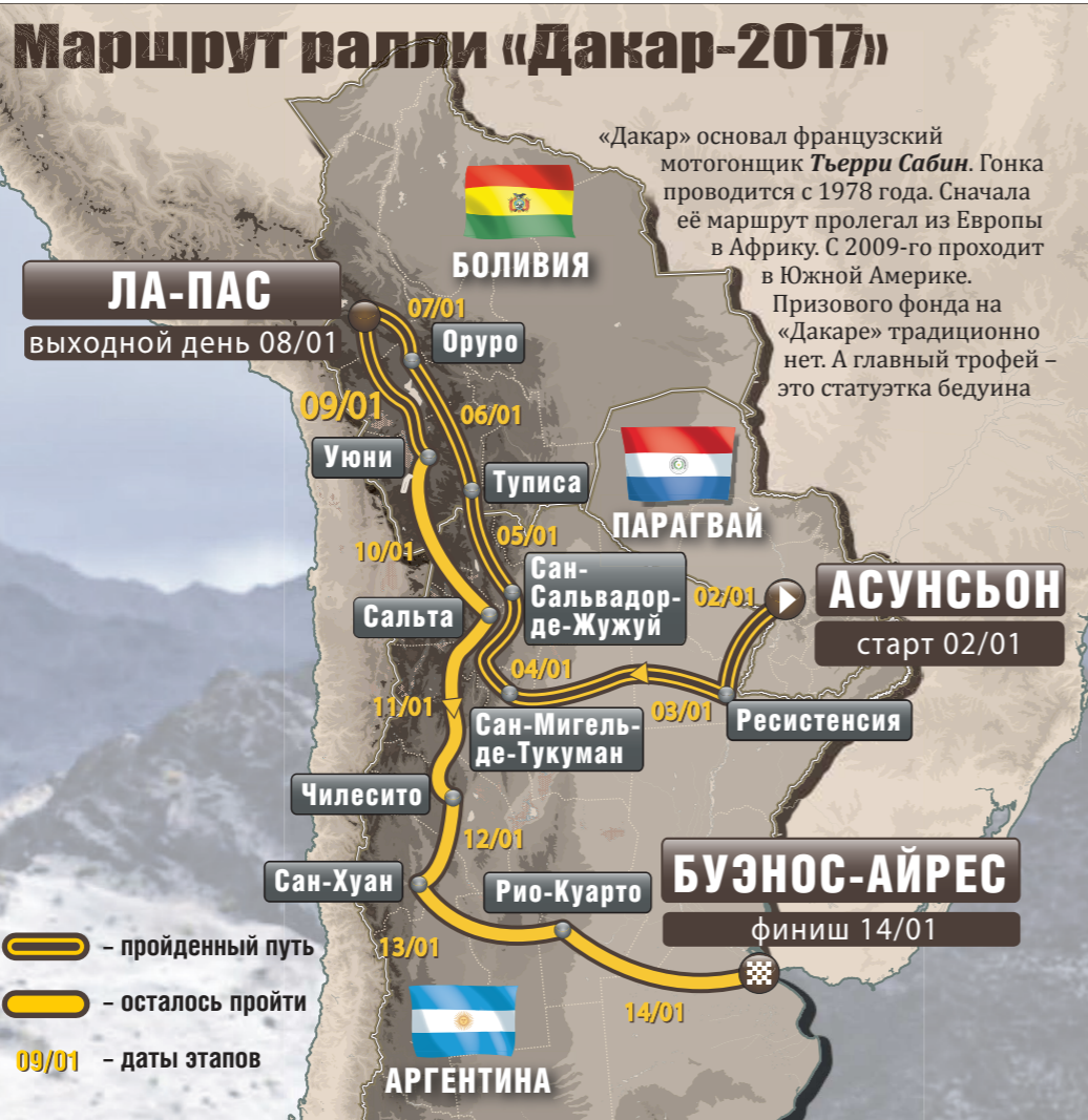
«Дакар-2017» завершится 14 января в Буэнос-Айресе. За две недели участники и караван технической поддержки проедут около 9000 км