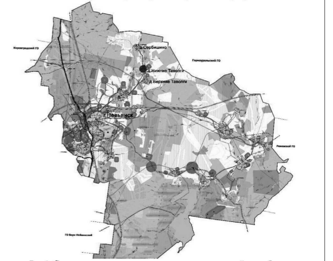
Рис.1. Схема расположения участка проектирования линейного объекта на территории Невьянского городского округа

Территория проектирования линейного объекта расположена в северо-западной части деревни Нижние Таволги Невьянского городского округа Свердловской области в кадастровом районе № 66.15. Территория размещения линейного объекта транспортной инфраструктуры (участок проектирования) принят с учётом существующей полосы отвода, дополнительной полосы отвода, придорожной полосы участка автомобильной дороги, условно нанесённой (с учётом застройки территории) придорожной полосы в границах населённого пункта и составляет 4,60 га. Участок проектирования для линейного объекта размещается на стыке четвёртых кадастровых кварталов с номерами 66:15:0401001, 66:15:0402001, 66:15:0601001 и 66:15:0601002. Кадастровый кварталы 66:01:3101001 и 66:15:0601002 являются территорией деревни Нижние Таволги. Местоположение участка проектирования приведено на рисунках 1 и 2.