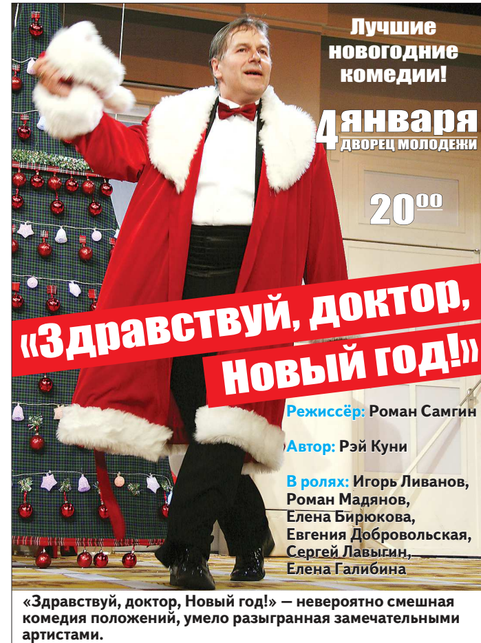
«Здравствуй, доктор, Новый год!» – невероятно смешная комедия положений, умело разыгранная замечательными артистами.