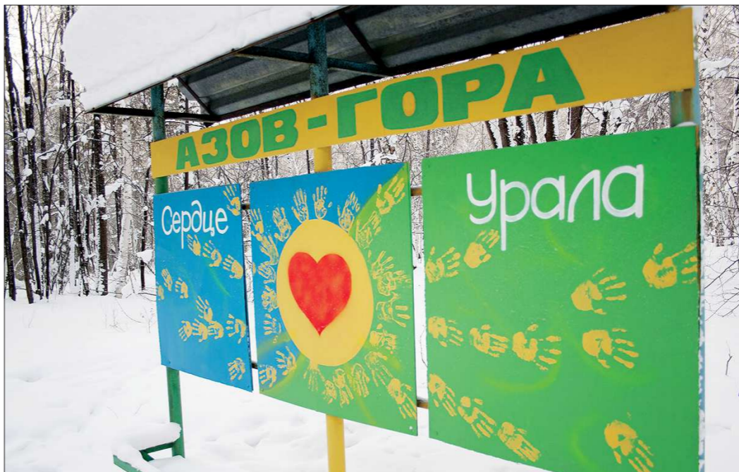
Пик популярности экскурсий в окрестностях горы Азов приходится на лето и раннюю осень, но прогуляться по маршруту можно и зимой — авторы проекта следят за состоянием тропы и информационных стендов