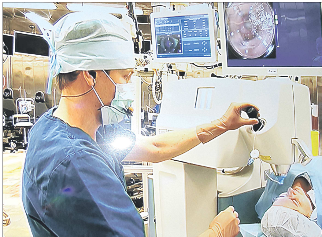
Операция по имплантации искусственного хрусталика длится порядка 15 минут и практически безболезненна