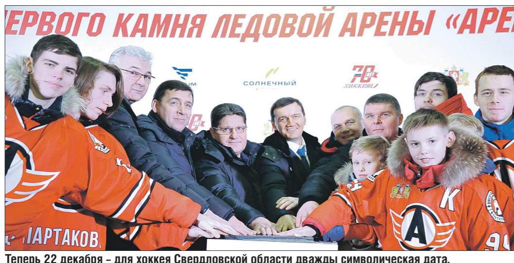
Теперь 22 декабря — для хоккея Свердловской области дважды символическая дата. Новая хоккейная площадка появится на улице Лучистой

Журналисты «ОГ» проведут трансляцию на oblgazeta.ru. Данил ПАЛЮВОВА