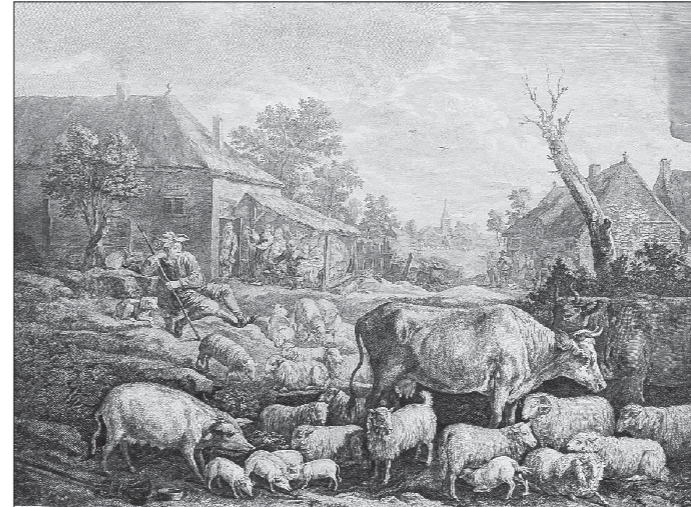
Офорт Пьера Антонио Мартини (1738-1797) и Жана-Филиппа Леба (1707-1783) «На базаре» (1774 год) с оригинала Давида Тенирса Младшего (1610-1690)

енные в путешествиях по Европе и России. Можно увидеть национальные костюмы Чувашии и Сибири, которые привлекли внимание французских художников.