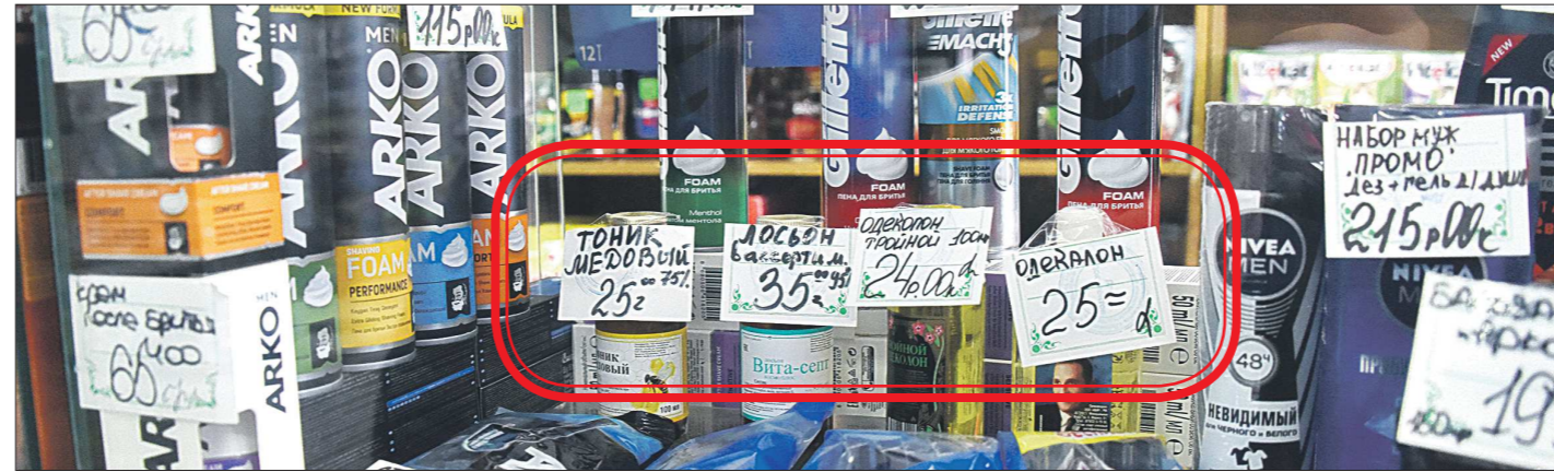
Этот снимок был сделан две недели назад в селе Полдневая Полевского городского округа. На витрине тоник «Медовый» и лосьон «Вита-септ». Два дня назад СМИ сообщили о том, что в Чите и Якутске полицейские изымают из магазинов лосьон «Вита-септ»