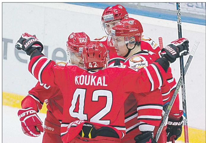
Шансы на попадание в плей-офф «Автомобилист» сохраняют, всё решится, как и в прошлом сезоне, в последних турах