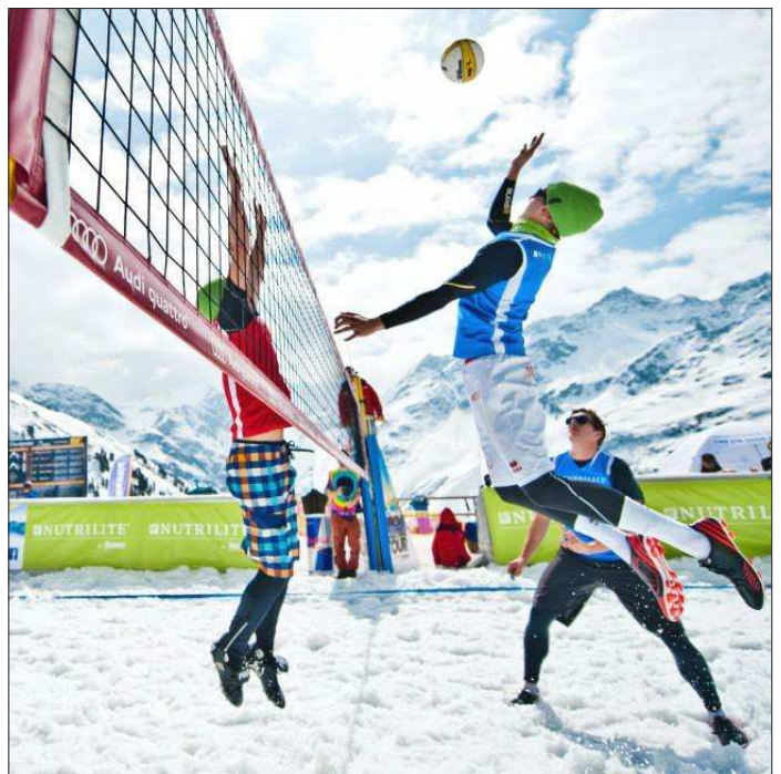
В волейбол на снегу играют в тёплых кроссовках, кофтах, шапках и даже куртках. Но при этом без перчаток

Стоит отметить, что волейбол на снегу стремительно развивается. Весной в Сочи прошли выставочные мат-