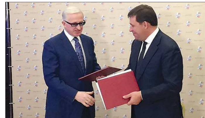
Губернатор Евгений Куйвашев (справа) и президент РСПП Александр Шохин подписали соглашение о сотрудничестве между правительством Свердловской области и РСПП в сфере развития национальной системы профессиональных квалификаций