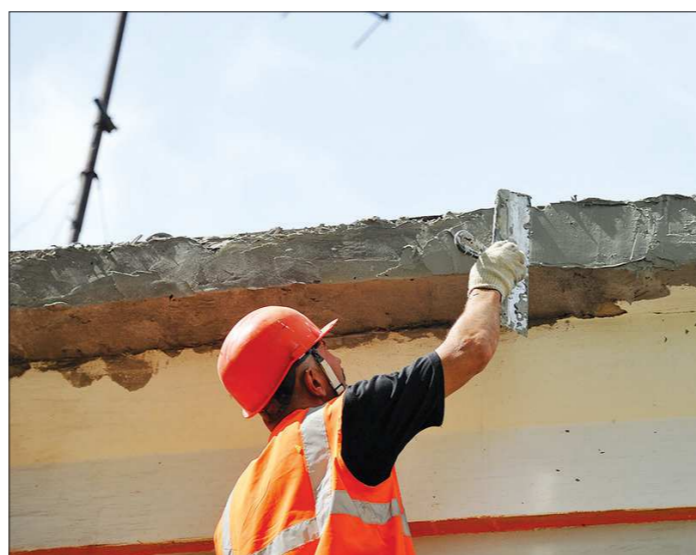
Большую часть работ подрядчики стараются выполнить летом, но не всегда успевают

Наверстаки упущенные за прошлый год. В 2015 году из 1 205 домов отремонтировали только 133, ещё 236 зданий исключили из плана в связи с нецелесообразностью проведения работ или необходимостью переноса на более поздний срок.