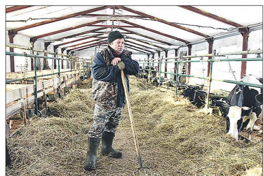
Холостинины мечтают увеличить поголовье коров до 50, но некуда ставить молодняк. Так что планы на будущий год — строительство телятника

Хозяйство Холостининых расположено в селе Октябрьское. Когда-то здесь было отде-