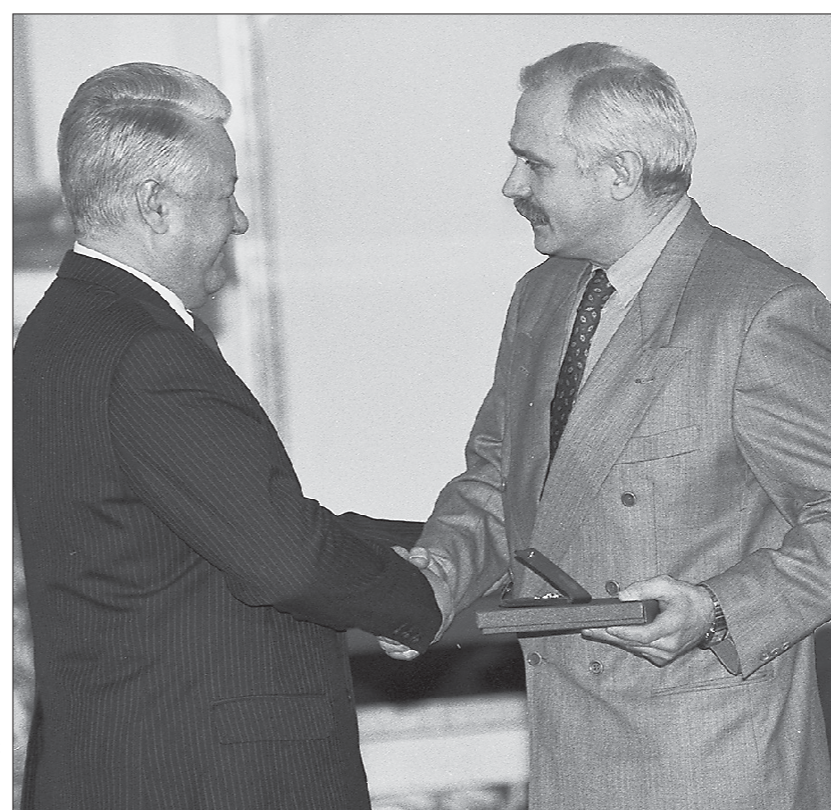
Первый Президент России не раз награждал Никиту Михалкова, а в 1996 году предложил ему стать своим доверенным лицом. Никита Сергеевич ни разу не сказал «нет» Борису Николаевичу