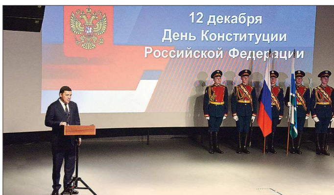
Ельцин Центр уже не первый год становится точкой притяжения в День Конституции. В прошлом году там прошёл гражданский форум, участие в котором также принял губернатор области

Василий ВОХМИН, из очерка «Революция на фоне очереди» («ОГ» за 11 июня 2011 года).