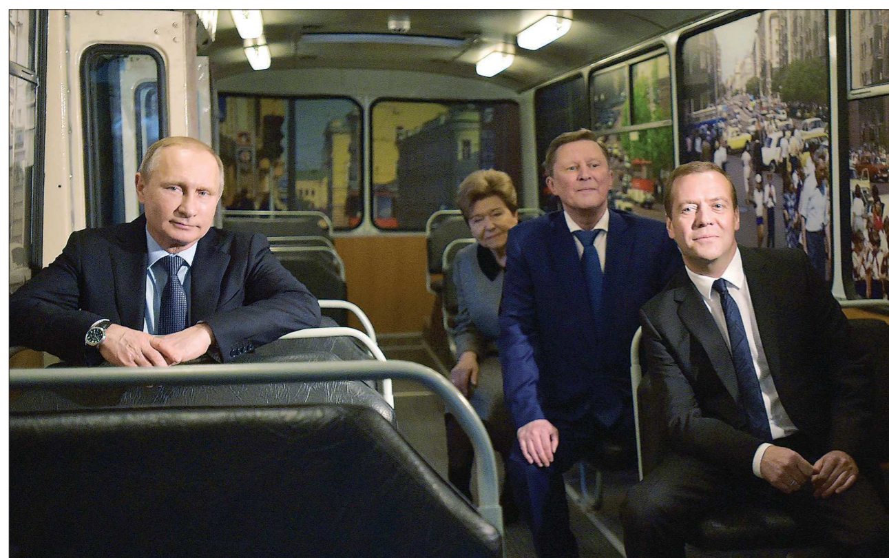
В открытии Ельцин Центра 25 ноября 2015 года приняли участие Президент РФ Владимир Путин, вдова первого Президента России Наи́на Ельцина, бывший в то время руководителем администрации Президента РФ Сергей Иванов и премьер-министр РФ Дмитрий Медведев. Они отмечали честность и мужество Бориса Николаевича и уникальность экспозиции в музее

Высказывания Никиты Михалкова вызвали недоумение у свердловчан