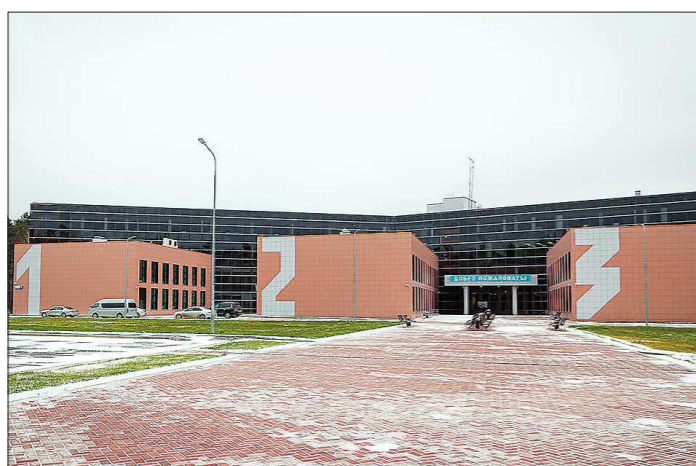
Фонд разместится в Екатеринбурге на площадке технопарка «Университетский»

Сегодня в полной версии «ОГ» публикуется постановление регионального правительства о создании Фонда технологического развития промышленности Свердловской области. Организация займётся финансовой поддержкой промышленных предприятий за счёт средств областного бюджета.