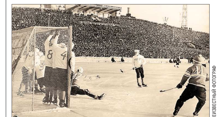
Попасть в «условно закрытый» Свердловск иностранец мог только если он был крупным политиком или спортсменом. На фото: матч СССР — Норвегия во время чемпионата мира 1965 года в Свердловске

Сегодня иностранцы в Екатеринбурге — не редкость, а норма жизни. В городе работают представительства зарубежных компаний, в вузах учатся иностранные студенты, да и просто туристы из других стран (далеко не только СНГ) всё чаще посещают уральскую столицу. Летом этого года Екатеринбург вошёл в топ-10 самых популярных российских направлений среди иностранных путешественников (по данным портала kayak.ru ).