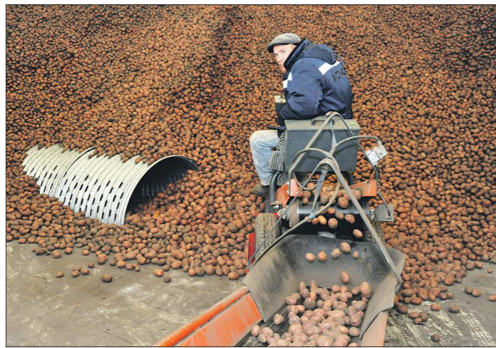
Ежедневно до 40 тонн продукции уходит со складов логистического центра в торговые сети

От логистического центра в Сухом Логе рукой подать до неофициальной картофельной столицы Урала — села Барабы в городском округе Богданович. В сумме на территории этих городских округов ежегодно производят около