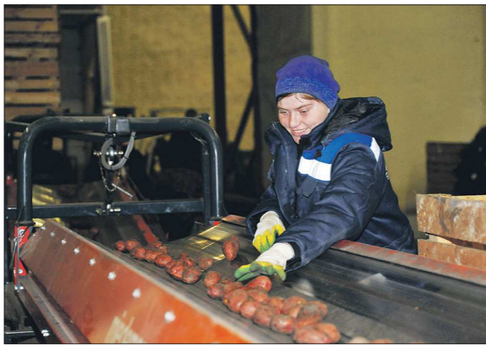
Наладив переработку картофеля и овощей, кооператив «Спас» создал 46 рабочих мест

Современное оснащение логистического центра впечатляет. Так, в одном из хранилищ 1 200 тонн картофеля своего урожая складировало суходольское ООО «Исток» — предприятие является членом кооператива. Клубни хранятся навалом, и вид этой горы удивляет: ширина — 16 метров, высота — более четырёх, в глубину хранилища она простирается на 30 метров. Если просто сложить вместе такое количество картошки, то она быстро начнёт гнить и сгнить. Однако здесь смонтирована сложная система поддержания заданного микроклимата, с воздушными тоннелями, с датчиками температуры воздуха и влажности, с устройствами принудительной вентиляции, которые позволяют избирать порчи. Все процессы происходят без участия человека: например, при повышении температуры автомати-