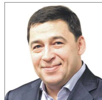
Евгений КУЙБАШЕВ, губернатор Свердловской области:

— Мы проанализируем тезисы Послания президента, будет составлен план реализации поручений главы государства. Они будут касаться экономики, социальной сферы, развития малого и среднего бизнеса, а также других направлений. Мы примем соответствующие решения. Установки главы государства напрямую касаются всех жителей Свердловской области. Так, в Послании большое внимание было уделено развитию социальной