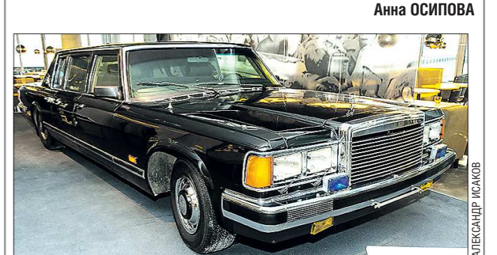
Лимузин Ельцина — самый популярный экспонат в музее первого Президента, почти никто не уходит отсюда без фотографии на фоне шикарного ЗИЛа

После распада СССР технология стала общедоступной и используется многими производителями. Сегодня оригинальный ЗИЛ-41052 можно купить, однако цена доступна не каждому олигарху — от 600 до 900 тысяч долларов. Екатеринбургу лимузин достался бесплатно — федеральная служба охраны передала его безвозмездно — в дар Ельцин Центру.