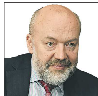
Павел КРАШЕНИННИКОВ, депутат Государственной думы, председатель комитета по государственному строительству и законодательству:

лый и средний бизнес оказался в положении «бедного родственника». Крупные и системообразующие банки не занимаются его проблемами в силу того, что у них есть более серьёзные и важные, а маленькие региональные банки не занимаются в силу того, что это высокие риски, так как все процедуры, которые сегодня прописывает Центральный банк, для малых банков достаточно обременительны.