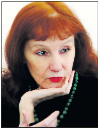
Старый год завершает свой спринт. Все опять повторяется снова: Бой курантов... Последний удар... Пять минут — президентского слова...

Родилась 1 декабря 1946 года в Екатеринбурге (Свердловске). Член Союза писателей России (СССР) с 1981 года.