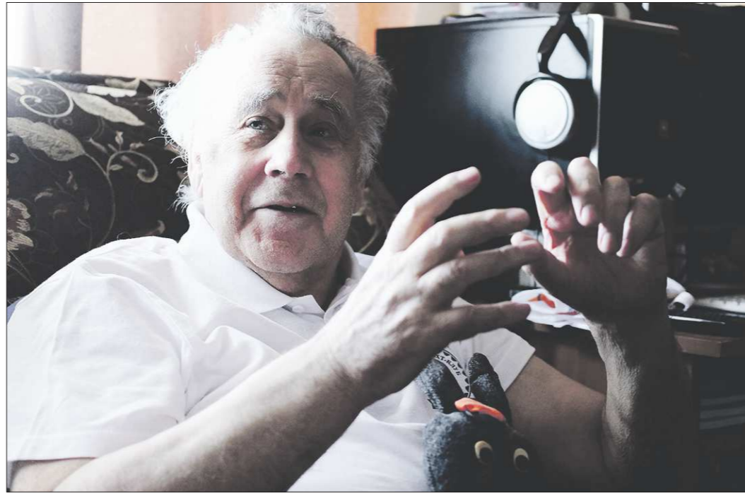
Владислав Крапивин создал два мира: реальный — «Каравеллу», и придуманный — на страницах книг

— Библиотеку в честь вас называют, фестиваль Крапивина проходит... Вы сами ощущаете, что вы — классик?