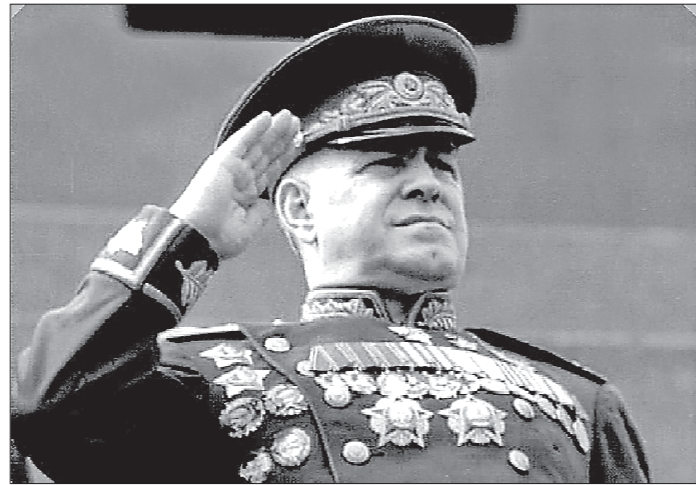
У маршала-победителя было очень много наград, друзей и врагов. В его службе и жизни всё было неоднозначно

— Благодаря тому что в ней выступили многие авторы, она получилась разноплановой, есть даже глава о на-