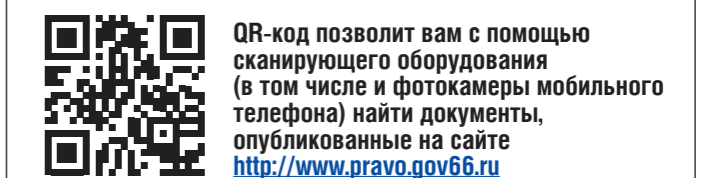
QR-код позволит вам с помощью сканирующего оборудования (в том числе и фотокамеры мобильного телефона) найти документы, опубликованные на сайте http://www.pravo.gov66.ru