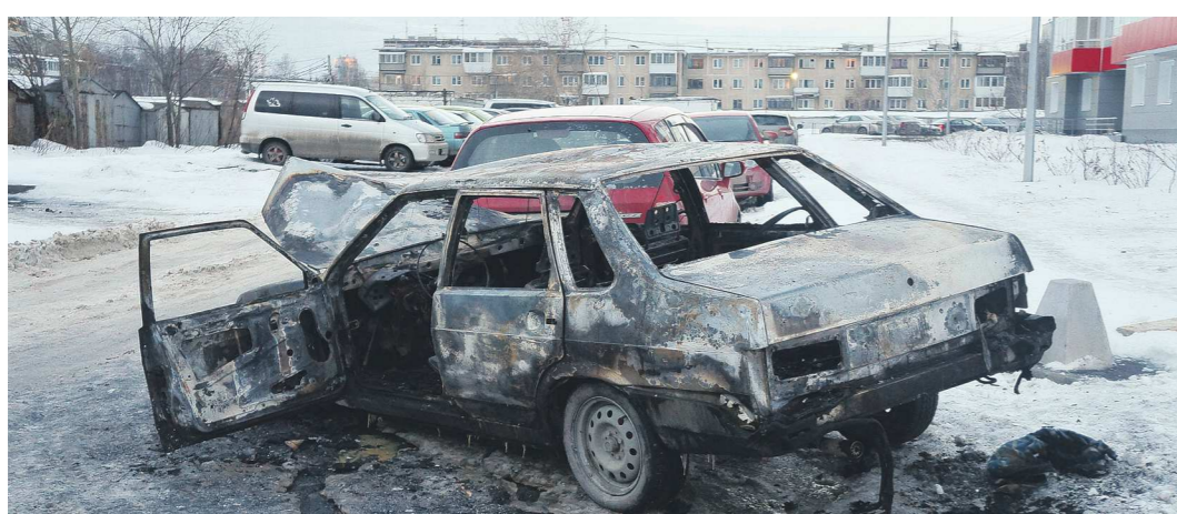
Огонь почти полностью уничтожил вазовскую «девятку», сгоревшую на Рассветной. С начала года на территории области произошло более 550 пожаров на автомобильном транспорте