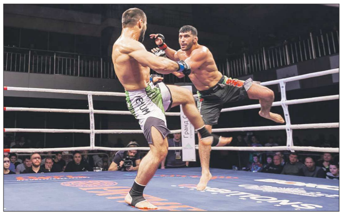
Участие в соревнованиях приняли 11 уральских бойцов из Екатеринбурга, Талицы и Берёзовского, а также спортсмены из Украины, Киргизии и Казахстана