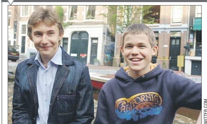
Одна из первых фотографий Сергея Карякина (слева) и Магнуса Карлсена. Сделана она десять лет назад - в 2006 году

Сергей Карякин старше Магнуса Карлсена больше чем на полгода. Карякин родился 12 января 1990-го, а Карлсен 30 ноября этого же года.