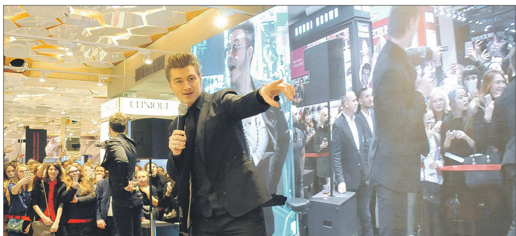
Алексей Воробьев пел, танцевал и фотографировался с первыми рядами фанатов - остальные наблюдали за действием на большом экране