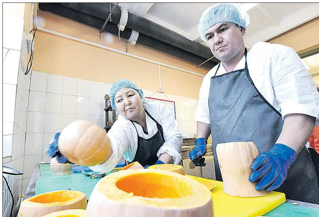
Каждый продукт производят в определённый период года: летом — сушат иван-чай и готовят цукаты из ревеня, в конце лета — перерабатывают ягоды, а зима — время тыквы

— Я — профессиональный телеоператор, проработал в