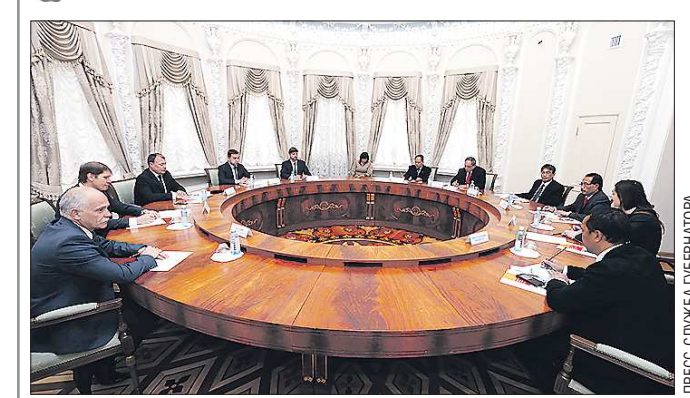
Вчера первый вице-губернатор Свердловской области Алексей Орлов обсудил увеличение товарооборота и развитие кооперационных связей с Чрезвычайным и Полномочным Послом Республики Индонезия в Российской Федерации и Республике Беларусь Мохаммадом Бахидом Суприяди.

Стороны заинтересованы в сотрудничестве в сферах горнодобывающей промышленности, транспортного машиностроения, железнодорожного строительства, фармацевтики, подготовки специалистов. Г-н Суприяди заявил о готовности республики увеличить в Свердловскую область поставки рыбы, чая, кофе, электронного оборудования и добавил, что в Индонезии большим спросом пользуются мотоциклы «Урал».