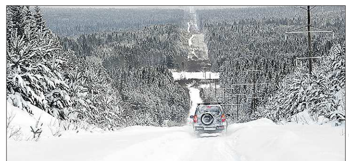
Главы муниципалитетов, которых назвали в числе отстающих, обещают заключить все контракты по содержанию зимних дорог в срок

— Возю своих старых клиентов в Южную Америку, Австралию, но сегодня это для меня не главное. В Екатеринбурге эти товары продаются через магазинчики экзопродуктов, но есть уже заказы из других регионов, а некоторые везут уральские цукаты в подарок знакомым.