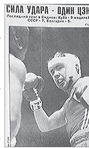
Сила удара — один Цзю. Последняя победа в Сиднее: Кубок мира, СССР - 7, Австралия - 6.