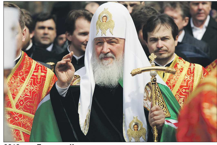
2013 год. Патриарх Кирилл во время своего второго визита в Свердловскую область в монастыре на Ганиной Яме