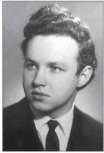
1960-е годы. Будущий Патриарх Кирилл. Больше фото — на oblgazeta.ru

На Среднем Урале Патриарх Кирилл бывал дважды: в 2010 и 2013 годах.