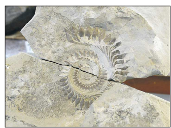
Самый ценный экземпляр коллекции — отпечаток зубного аппарата геликоприона

— Младшему внуку сейчас шесть лет, старшему — девять. В походы они со мной ходят уже три года, с самого раннего возраста. Уже различают виды растений в окаменелостях, сами не раз находили трилобитов, знают, как выглядят кости динозавра. У них есть свои рюкзаки, профессиональная экипировка. Ходить на раскопки им очень нравится, глаза горят, — рассказала «ОГ» палеонтолог-любитель.