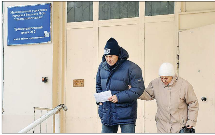
В Екатеринбурге травматологическая помощь налажена во всех районах, чего не скажешь о других муниципалитетах