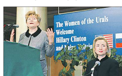
Хиллари Клинтон (справа) и Нина Ельцина во время встречи в УПИ