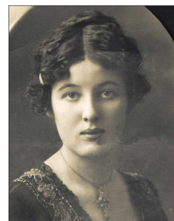
Если вы узнаете девушку на фото, напишите в редакцию «ОГ» на адрес alena@oblgazeta.ru или позвоните по номеру +7 (343) 355-37-50