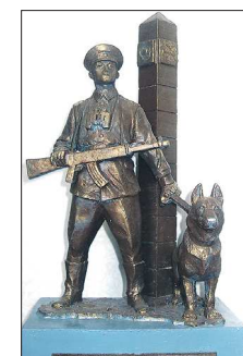
Макет памятника пограничникам. Автор — Игорь Акимов