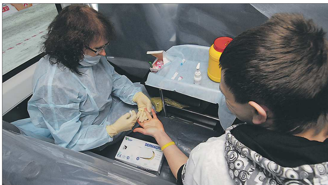
В Екатеринбурге в Областном центре профилактики и борьбы со СПИДом (Ясная, 46) работает кабинет анонимного тестирования на ВИЧ и консультирования