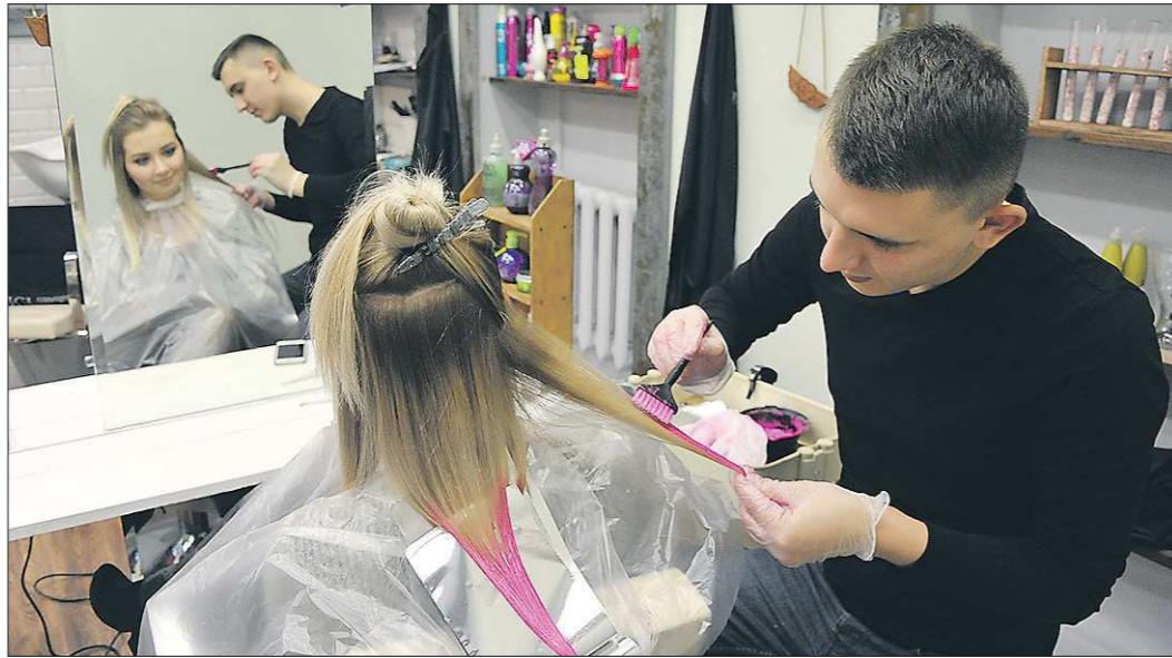
Цветные пряди на висках или затылке при необходимости можно легко спрятать в причёску

На улицах Екатеринбурга всё чаще можно встретить людей с нестандартным цветом волос: яркими тонами красного, зелёного, синего, фиолетового, жёлтого или розового. Окрашены могут быть только какие-то прядки, либо все волосы. По словам стилистов-парикмахеров, отчасти это вызвано тем, что хороший выбор таких красок в салонах столицы Урала появился лишь недавно. Но, видимо, есть и запрос общества, раз услуга окрашивания в яркие цвета быстро стала так популярна.