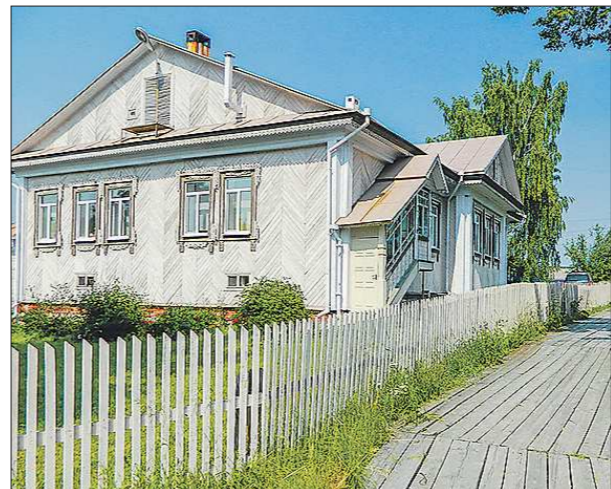
Дополнительные очки сёлам-конкурсантам начисляют за деревянные тротуары: в Меркушино это требование выполнено