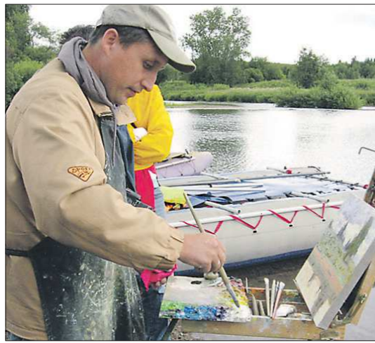
В Чусовом очень любят гостить художники — специально для них в окрестностях села проводится ежегодный фестиваль-пленэр «АРТ Чусовая»