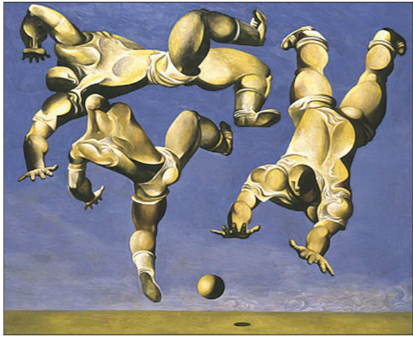
Картина «Игра в мяч» (1965) в 2006 году была продана на известном аукционе «Сотби» за 108 тысяч фунтов стерлингов. По нынешнему курсу это примерно 8,5 миллиона рублей