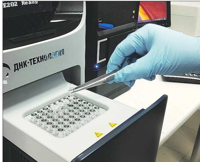
Один из этапов обнаружения ГМО в продукции заключается в достраивании цепочки ДНК

— Уже доказано, что люди, питающиеся продукцией, содержащей ГМО-объекты, быстрее полнеют, есть факты наличия гормональных изменений, влияния на ход процесса беременности, иммунитета, нарушение дисбиоза слизистых, особенно кишечного тракта, чувствительности организма к антибиотикам и так далее. Многочисленные опыты на животных подтверждают, что ГМО может неблагоприятно отразиться на будущем потомстве. Поэтому точно сказать, как ГМО скажется на человеке, мы сможем лишь через поколение, а это 50 лет. На данный момент статистическая база данных не позволяет нам с полной уверенностью