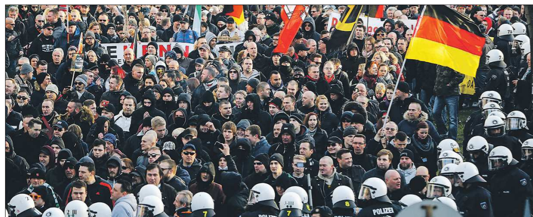
Граждане Германии на демонстрациях протестуют против исламизации страны, выдвигая требования изменить миграционную политику

Сейчас в Сирии наступил час истины. Сейчас в Сирии наступил час истины. Оценивая наше участие