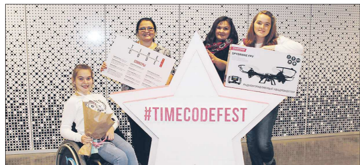
Корреспонденты интернет-телевидения «Айсберг ТВ» победили в специальной номинации «Мне не всё равно»