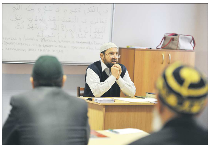
Изучение арабского языка – важная часть программы школы имамов. Он необходим, чтобы читать Коран в оригинале и правильно трактовать его строки

Как будет продвигаться создание общественной организации – покажет время. Уже сейчас, по словам некоторых активистов, есть опасения за тех, кто станет во главе объединения.