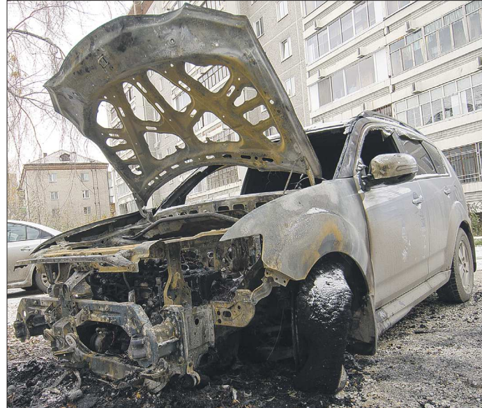
Так и хотелось бы сказать про эту сгоревшую машину – последняя, в смысле – больше поджогов не будет, но это последняя сгоревшая вчерашней ночью