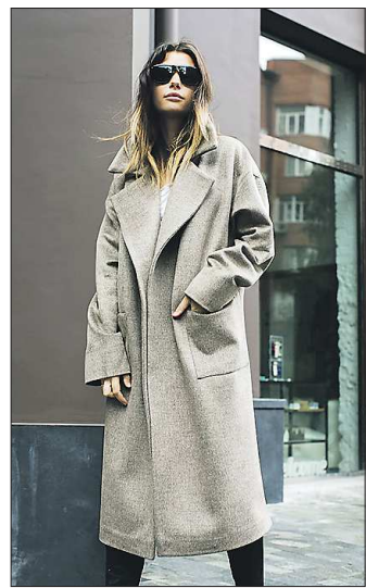
Ещё один образец популярного пальто — от бренда «StammStamm». Серые и пудровые оттенки есть в каждой коллекции