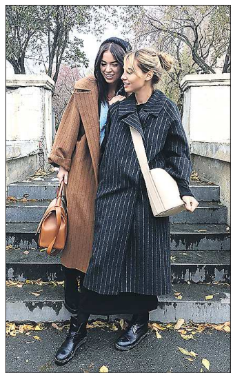
Пальто из новой коллекции бренда UShatava — типа «оверсайз», с широким воротом, в полосу. В этом сезоне они стали хитом