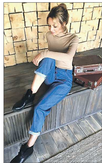
Бренд UShatava предлагает водолазки в разных расцветках, но самым популярным стал карамельный

что сейчас многие стараются упростить свои произведения. Отчасти это направлено на большие продажи. Тех, кто делает авангард, сейчас очень мало. А с другой стороны, это направлено и на комфорт и удобство.