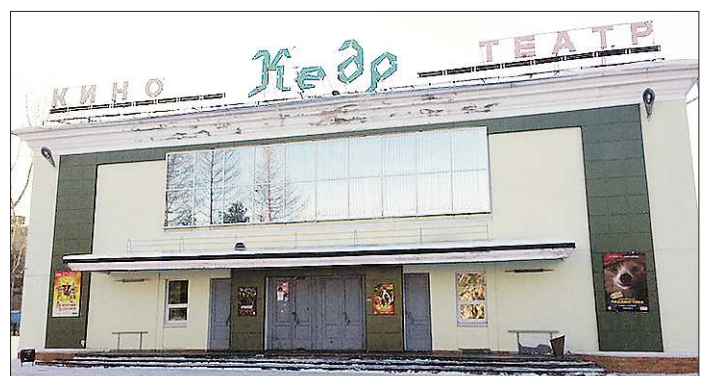
Модернизированные кинозалы уже действуют в Верхней Салде (на фото), Камышлове, Богдановиче, посёлке Булаш. Готовятся к открытию кинотеатры в Нижних Сергах, Верхотурье и Ивделе