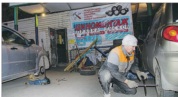
У шиномонтажников уже неделю идёт сплошной «чёр», даже курят на ходу. Клиент едет днём и ночью, так что лучше заранее записаться, в живой очереди можно застрять надолго

Поправки содержат в себе очевидные для опытных водителей нормы: шины с шипами должны быть установлены на всех колёсах, причём на одну ось запрещено ставить покрышки разной размерности, скоростных индексов, конструкции и рисунков протектора. Определены, что важно, параметры непригодных к эксплуатации шин: остаточный износ протектора менее 1,6 мм для летней резины и 4 мм — для зимней (с маркировкой «снежинка», M+S, M&S, MS). Непригодными считаются также шины с пробоями и порезами, обнажающими корд, а также с расслоениями в каркасе и отслоениями протектора. Запрещено будет управлять машиной, если на колесе отсутствует хотя бы один крепёжный болт или гай-