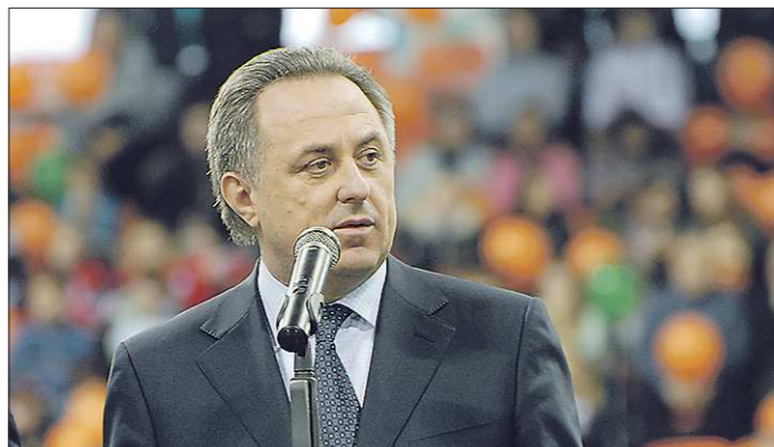
Виталий Мутко недавно вновь был избран на пост президента Российского футбольного союза. Пока неизвестно, будет ли он одновременно занимать оба поста, но в принципе это не запрещено

● Что бы хорошего или плохого ни сделал Виталий Мутко, будучи министром, главную память о себе в головах современников он оставил пламенной речью в декабре 2010 года на заседании исполкома ФИФА, посвящённом выборам страны — организатора чемпионата мира 2018 го-