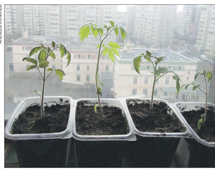
У окна можно и рассаду разместить, и целую композицию выстроить – скромный аналог зимнему саду