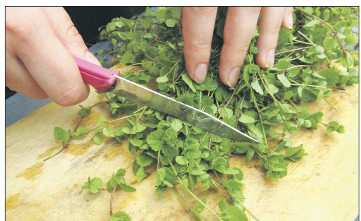
Душистая зелень, выращенная на подоконнике, станет прекрасной витаминной добавкой к вашему столу

ЗЕМЛЯ. Огородная или полевая земля в чистом виде для растений на подоконнике не подойдёт, так как после полива питательные вещества из неё будут вымываться, а сама почва сильно уплотнится. Свежий торф тоже не годится – в нём есть токсичные для растений вещества. Лучше всего использовать смесь из огородной, полевой или дерновой земли с перегноем, торфом и компостом. Но для каждого овощного растения предпочтителен грунт определённого состава, поэтому лучше купить в специализированном магазине готовую грунтовую смесь.