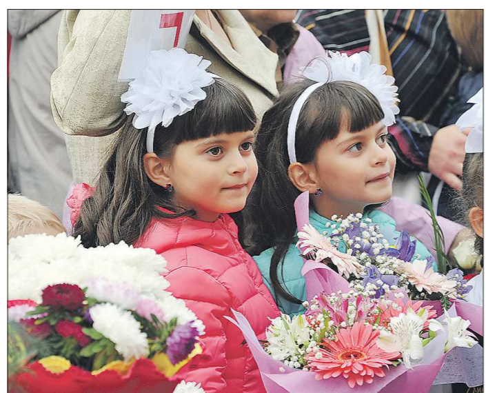
За последний год в регионе родилось 834 пары двойняшек

О ДЕТЯХ. В регионе в 2015 году родилось около 63 тысяч малышей, причём отмечено увеличение количества родившихся вторых, третьих и четвёртых детей в семьях. Кроме того, в прошлом году на Среднем Урале родилось рекордное как минимум за последние пять лет количество двойняшек — 834 пары. В 17 семьях родились тройни. Наи-