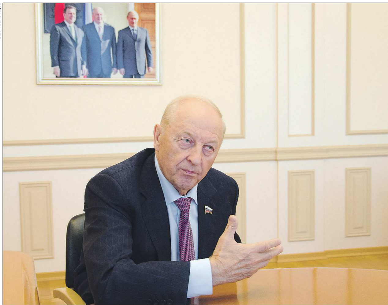
В кабинете Эдуарда Росселя висит исторический снимок — на нём изображены канцлер ФРГ Герхард Шрёдер, Эдуард Россель и Владимир Путин у здания резиденции губернатора Свердловской области. Кадр сделан в октябре 2003 года, когда в Екатеринбурге проходили российско-германские консультации