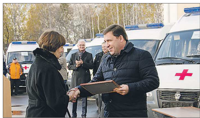
Евгений Куйвашев вручил ключи и документы на новые машины главврачам больниц из 28 муниципалитетов

Хозяйства в этом году заготовили много кукурузы. Она была нынче с початками, значит, и сухого вещества в таком корме будет больше. Расширили посевы рапса. Молочное животноводство получит больше рапсового жмыха, который позволит прибавить надой. Производство молока в области растёт с 2009 года, и мы ни разу не сорвались.