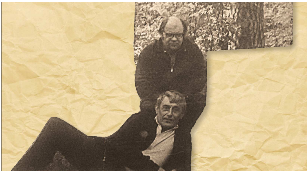
1973 г. Киев. Перед отъездом в эмиграцию. Наум Коржавин и Виктор Некрасов. Остальные участники съёмки впоследствии попросили фотографа урезать фото и фигурки — опасались возможных неприятностей со стороны КГБ

Коржавин написал о себе однажды: «Мне каждое слово будет уликой минимум на 10 лет». И оказался прав. Его арестовали 20 декабря 1947 года прямо в общежитии Литинститута. В разгар сталинской борьбы с космополитизмом термин «за антисоветскую деятельность» был фактически приговором. После Сири Коржавин приехал жить в Мытищи — в Москву его уже не пустили. Окончил институт, занимался переводами, писал для журналов. Но «нехватка воздуха для жизни», по словам самого поэта, становилась всё ощутимее. И в 1973 году он уехал в США, в Бостон. Сознал: эмиграция для него — тупик, но другого выхода не было. Он помнил, как на Лубянке его предупредили: «Мы с вами ещё встретимся...»