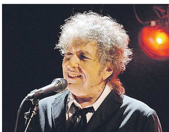
Боб Дилан — американский автор-исполнитель, художник, писатель и киноактёр. Культурная фигура в рок-музыке на протяжении пяти десятилетий. Ему 75 лет