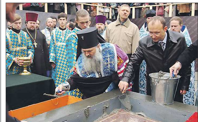
Архиепископ Екатеринбургский и Верхотурский Викентий заложил первый камень в основание храма Большой Златоуст