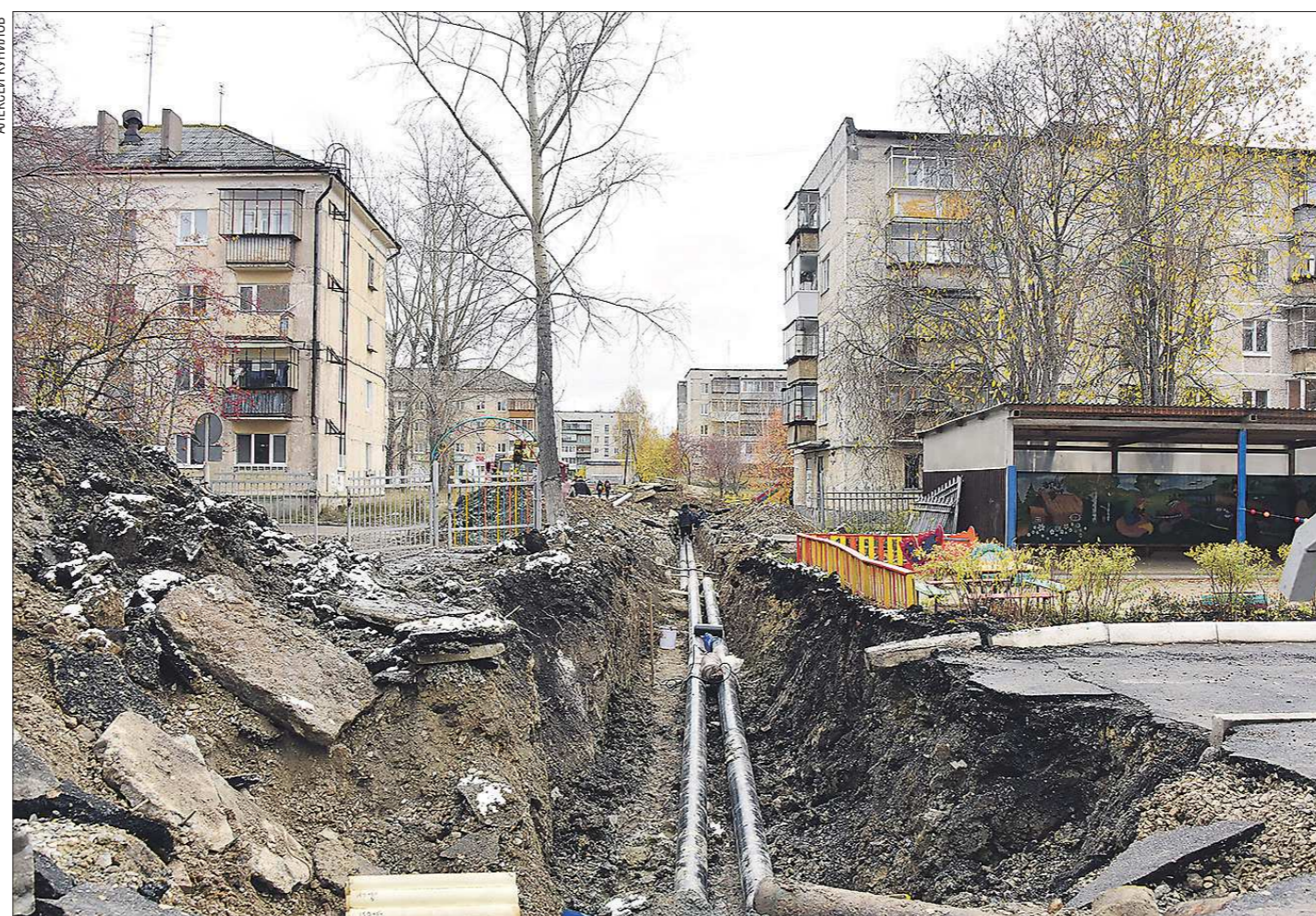
Так вчера выглядели несколько улиц Полевского (Торопова, Карла Маркса, Победы), где сейчас идёт замена труб. Раскопанную траншею уже припрорыло первым снегом