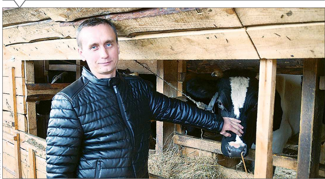
Салдинский заводчанин предпochёл цеху коровник