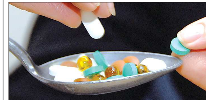
О возможности получения бесплатных лекарств обязаны информировать участковый врач

В 2016 году Свердловская область получит из федерального бюджета 119 миллионов рублей на приобретение медикаментов для людей, имеющих право на бесплатное получение лекарств. Об этом сказано в распоряжении правительства РФ о распределении между регионами России специальных трансфертов из федеральной казны.