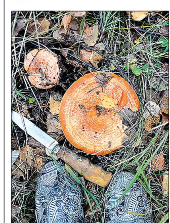
В этом году очень хорош урожай рыжиков — за пару часов легко можно собрать пятилитровое ведёрко. Больше фото — на oblgazeta.ru