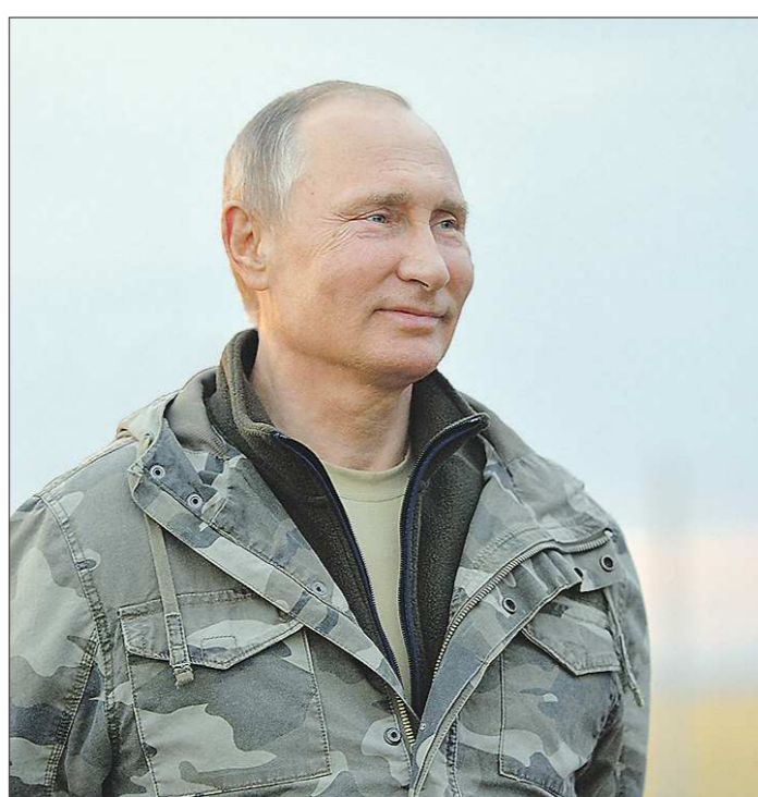
На днях Владимир Путин побывал в природном заповеднике «Оренбургский». На фото — он наблюдает за выпуском лошадей Пржевальского в естественную среду обитания