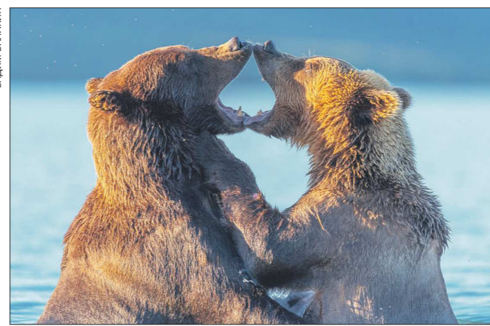
Фотограф считает этот кадр одним из самых удачных. Фигуры мишек словно образовали сердце...

– Сеть облетел кадр «Косолапая любовь» (см. первую полосу «ОГ»). Именно он стал кадром дня по версии сайта «National Geographic»