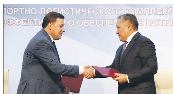
Губернатор Свердловской области Евгений Куйвашев и аким Карагандинской области Казахстана Нурмухамбет Абдибеков подписали соглашение о сотрудничестве

— Новые перспективы для совместных проектов запущены у нас в стране в городах опережающего развития. В том числе в территориях, близких к Казахстану, я имею в виду Урал, где с сентября действуют особые условия. Мы приглашаем казахстанский бизнес одним из первых среди иностранных инвесторов воспользоваться преимуществами этой особой экономической зоны, — заявил Владимир Путин.