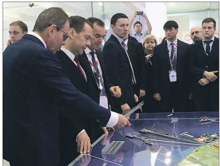
Председатель правительства России Дмитрий Медведев осматривает экспозицию Краснодарского края

МИНИСТЕРСТВО ПРИРОДНЫХ РЕСУРСОВ И ЭКОЛОГИИ РФ, ФЕДЕРАЛЬНАЯ СЛУЖБА ПО НАДЗОРУ В СФЕРЕ ПРИРОДОПОЛЬЗОВАНИЯ И ОО «УРАЛСБЕСТ» ПОДПИСАЛИ СОГЛАШЕНИЕ О СОТРУДНИЧЕСТВЕ. Согласно документу, предприятие в ближайшие два года должно снизить выбросы вредных веществ и исключить сброс неочищенных дренажных вод в реку Большой Рефт, а для этого — инвестировать в собственную экологическую программу около 75 миллионов рублей. По словам Евгения Куйвашева, участие промышленных предприятий в работе по экологическому оздоровлению региона — это яркий показатель их социальной ответственности.