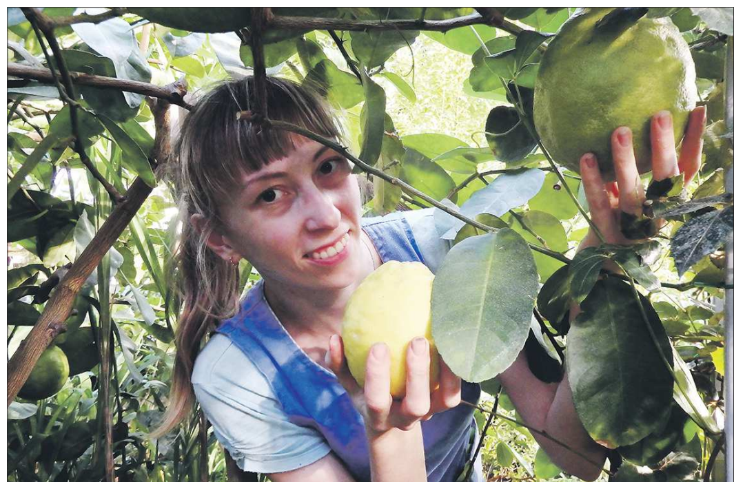
И в оранжереях, и в домашних условиях плоды лимона созревают в течение девяти месяцев