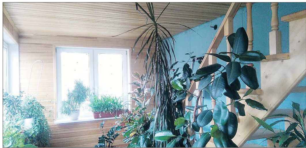
Зимний сад ещё не совсем готов, но зелёные друзья уже обживаются

Обустроить зимний сад — дело затратное, но если уж вы отважились на собственный загородный дом, то и зимний сад осилите. Начинать надо с выбора места. Мы, например, остановились на варианте второго этажа над верандой. Во-первых, примыкающую к дому надстройку сделать проще, чем возводить с нуля. Во-вторых, это восточная сторона, самая предпочтительная для зимнего сада. Оказавшись, на южной стороне слишком много солнца, даже у нас на Урале, и растения могут перегреться. Самая неподходящая сторона северная: слишком мало солнца. Очень серьёзный вопрос — отопление. Вот что советует профессиональный строитель Денис Денисов: — Поскольку зимний сад требует много света, нужно делать либо сплошное остекление, либо много окон. Даже если это современные стеклопакеты, всё равно будут повышены теплопотери, поэтому обычного норматива отопления — один киловатт на 10 квадратных метров — будет недостаточно, надо ещё набросить процентов 25. Вдобавок к обычным батареям можно постелить на пол панели инфракрасного излучения. По ним можно ходить, а тепло они дают равномерное по всей площади.