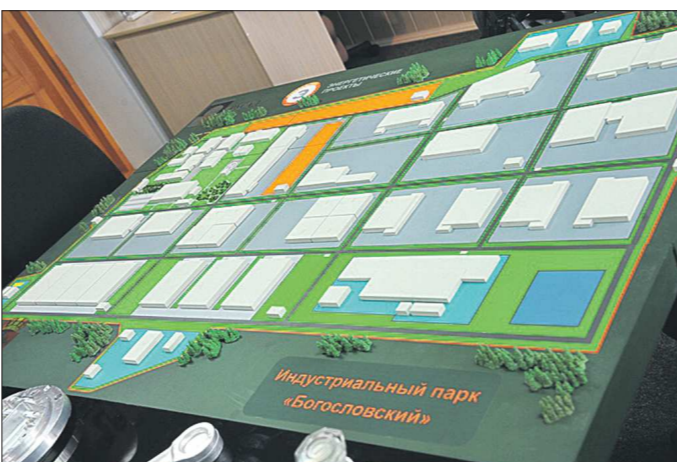
Индустриальный парк «Богословский», который всего пару лет назад существовал только на бумаге, поможет Красноуральску уйти от монопроизводства