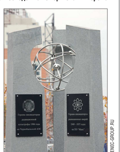
Памятный знак из серого гранита был открыт в день 57-й годовщины радиационной аварии на ПО «Маяк»

Мемориал был установлен на улице Суворова. Он представляет собой конструкцию из трёх каменных стел. Одна посвящена жертвам аварии на химкомбинате «Маяк», другая — погибшим ликвидаторам аварии в Чернобыле, третья — ныне живущим героям и их потомкам. Скрепляет их металлическая конструкция, символизирующая мирный атом.