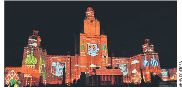
Изображения талисманов - Кота, Тигра и Волка - были спроецированы на фасад главного здания МГУ на Воробьёвых горах

бы Олег Табаков, с «наигрышем». Говорит громко, выразительно, словно переигрывая, но в чёрно-белом кадре (а фильм снят именно так) это достойный выразительный приём.